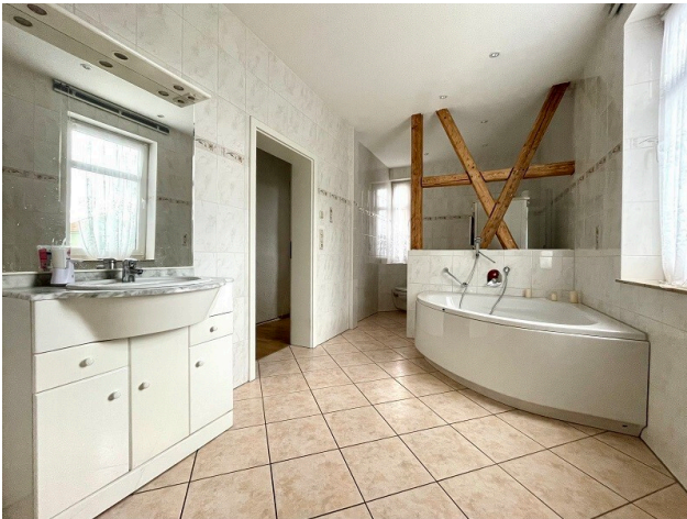
Fotobeispiel: Badezimmer Erdgeschoss