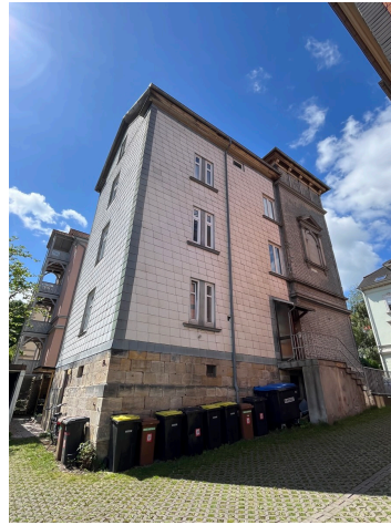
Fotobeispiel: Ansicht Hausseite