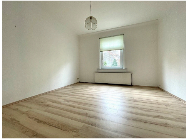
Fotobeispiel Erdgeschoss Zimmer