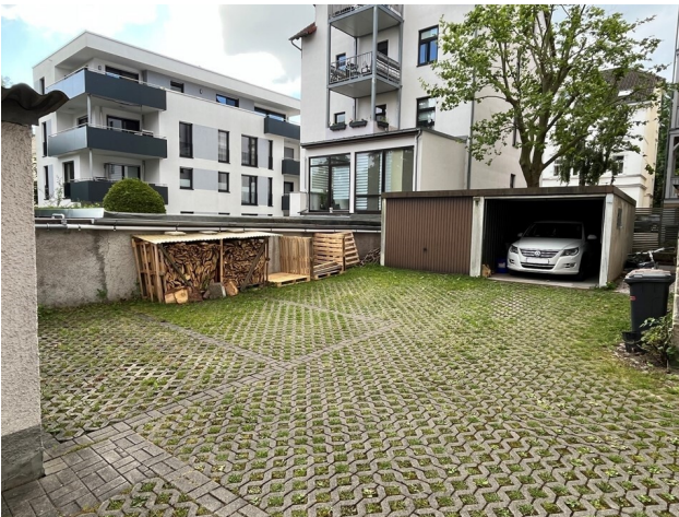
Fotobeispiel: Garagen und Stellplätze