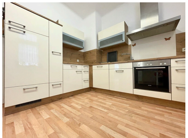
Fotobeispiel: Küche Erdgeschoss