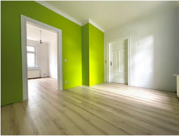
Fotobeispiel: Zimmer Erdgeschoss